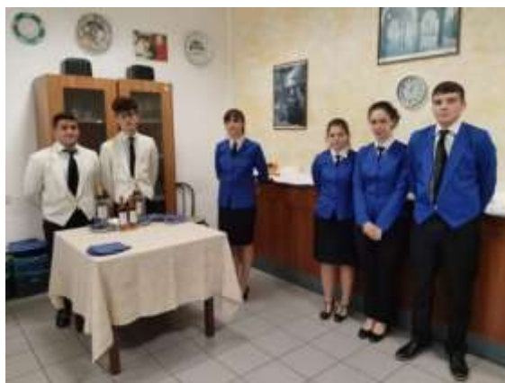
Fotografii: Studenții de la Istituto Alberghiero di Assisi, în bucătărie și sala de mese.