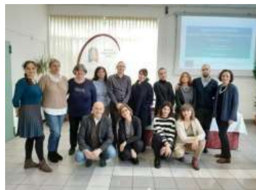
Foto: I membri del team di progetto

L'incontro di partenariato di apertura si è svolto presso l'Istituto Alberghiero di Assisi, partner del progetto insieme ad altre cinque organizzazioni e scuole di Belgio, Italia, Romania e Spagna.