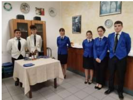
Foto: Studenti dell'Istituto Alberghiero di Assisi, in cucina e sala da pranzo.