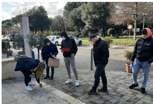
Foto: Studenti coinvolti nel progetto Games Without Barriers che svolgono attività pratiche di valutazione dell'accessibilità.

L'evento formativo e l'esperienza in generale sono stati valutati molto positivamente sia dagli studenti che dagli insegnanti coinvolti.