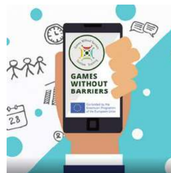
Games Without Barriers – Facebook Forum Page

proyecto, las sesiones de formación y los intercambios para apoyar el aprendizaje de los estudiantes y el desarrollo de los productos intelectuales.