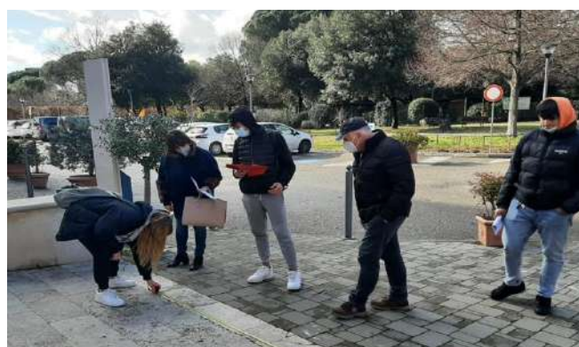
Fotografii: Elevii proiectului Jocuri Fără Bariere desfășoară exercițiul practic de evaluare a accesibilității.